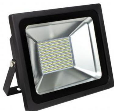
Projecteur LED Extérieur